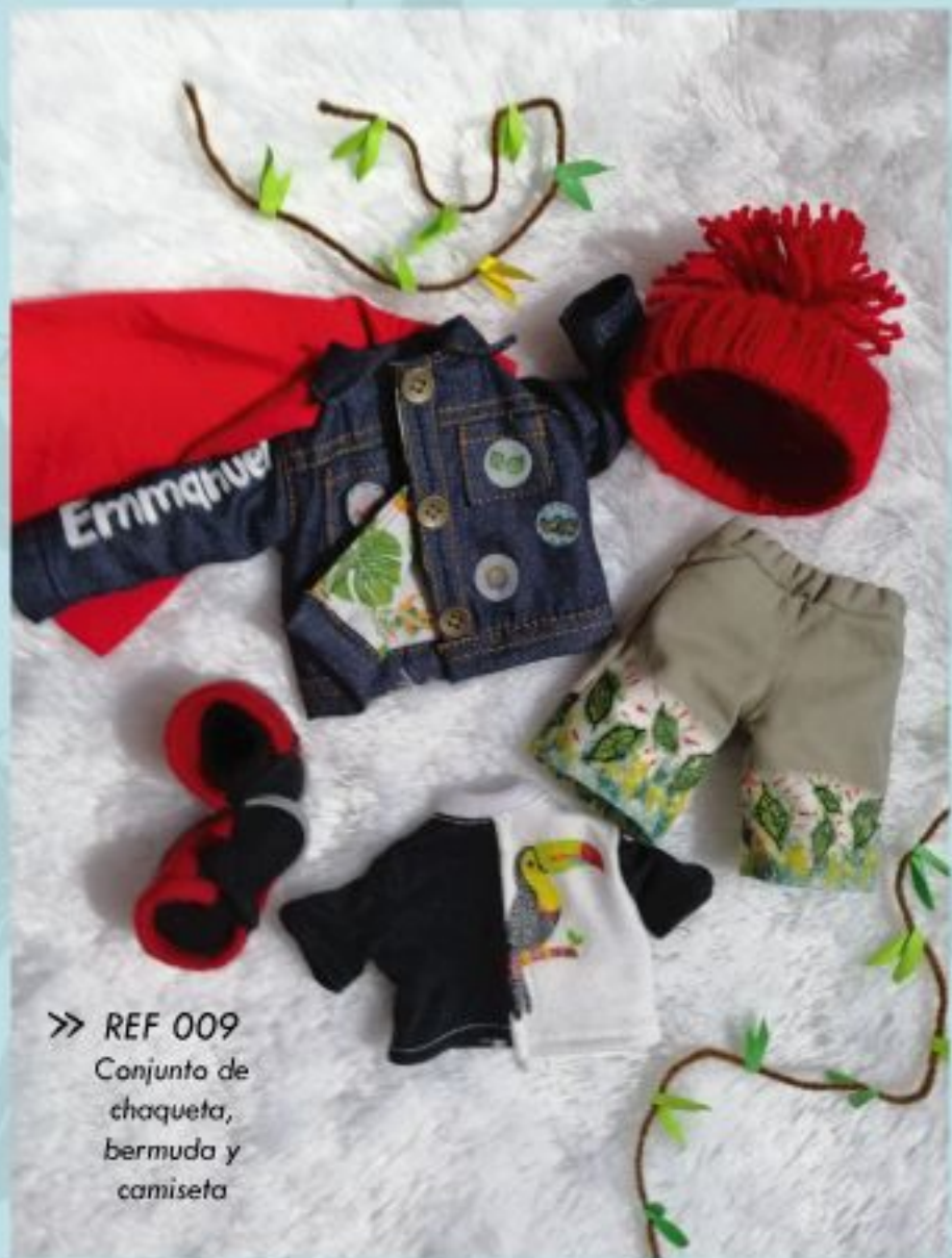
» REF 009 Conjunto de chaqueta, bermuda y camiseta