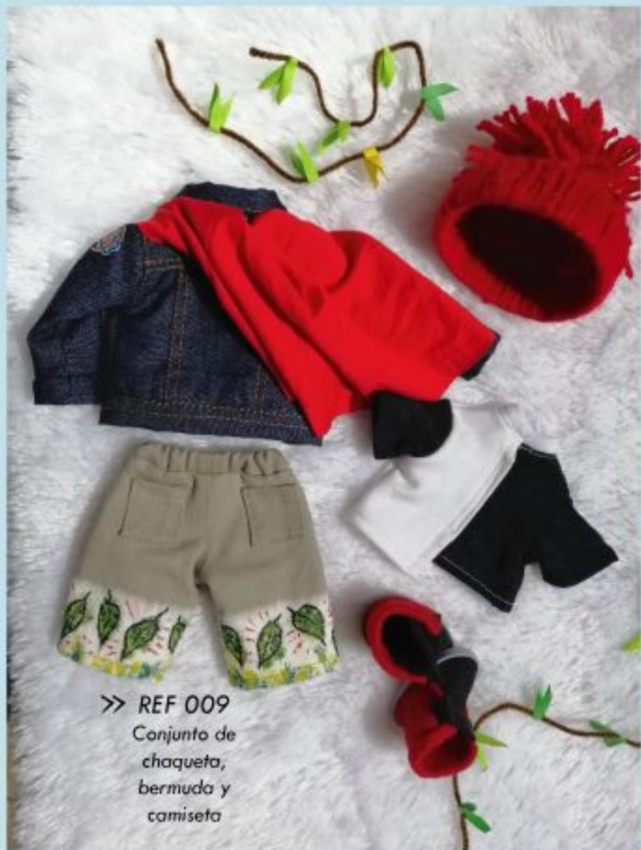
>> REF 009 Conjunto de chaqueta, bermuda y camiseta