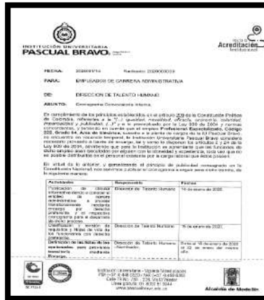
Fuente: Proceso de apoyo Gestión Talento Humano