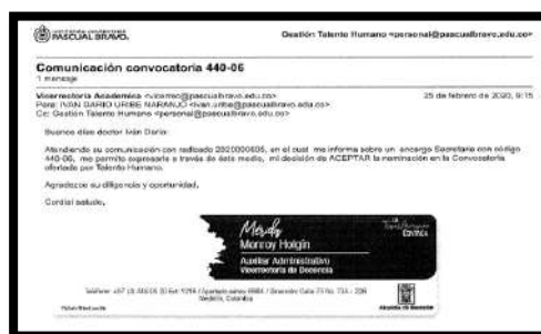
Fuente: Proceso de apoyo Gestión Talento Humano